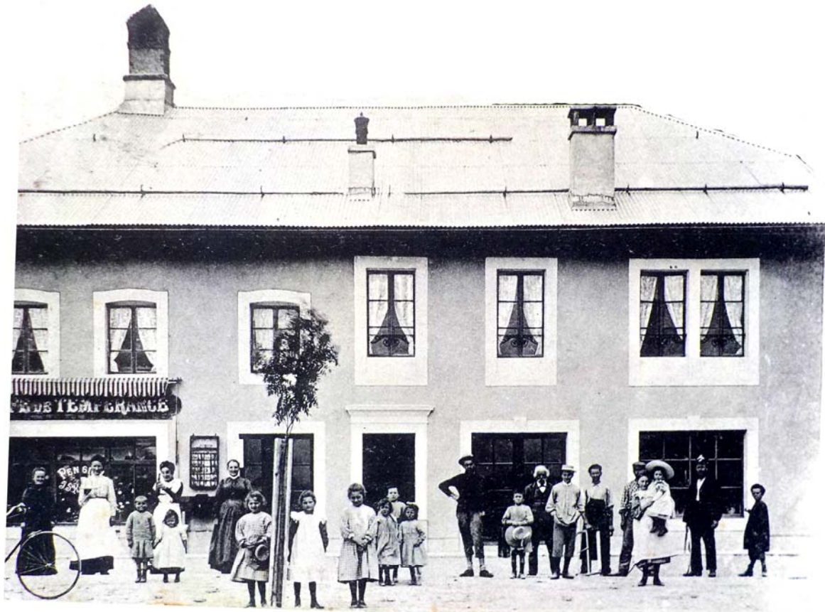
L'Hôtel de Tempérance sera repris dans les années vingt par l'un des frères Locatelli, Victor ou Antoine, afin d'en faire un garage.